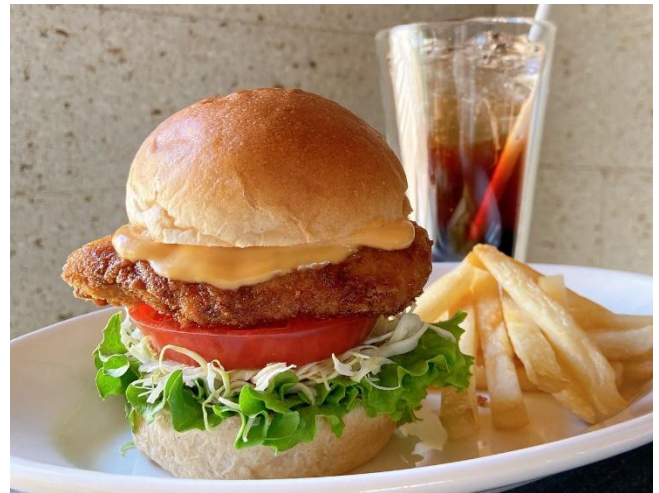
▲かるカツバーガー

『NATUREVERSE キッチン』では、NDCが手掛ける日本の伝統食材である大豆と米を活用した新しいプラントベース食品「かるあげ」を使った、「かるカツバーガー」や「かるカツサンドイッチ」、「かるカツコンボ」などを提供。様々な理由で動物性食材を控えたい方はもちろん、子どもからお年寄りまであらゆる方にプラントベースフードを気軽に楽しんでいただける機会を創出してまいります。