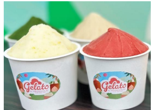
▲ヴィーガンジェラート