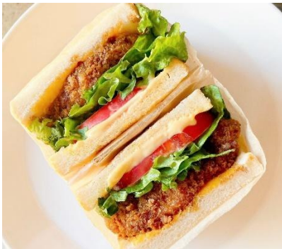
▲かるカツサンドイッチ